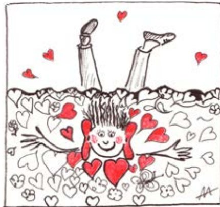
Zeichnung: Anke Müller